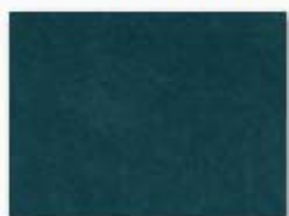
018 bleu canard