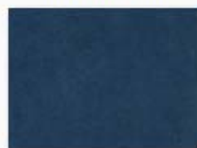
020 bleu de sèvres