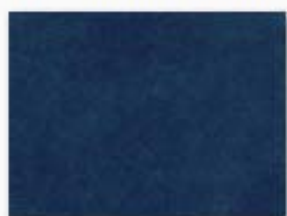
019 bleu royal