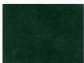
027 vert anglais