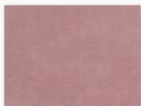
015 rose poudré