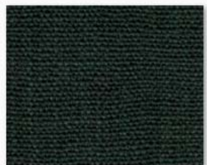
012 vert anglais