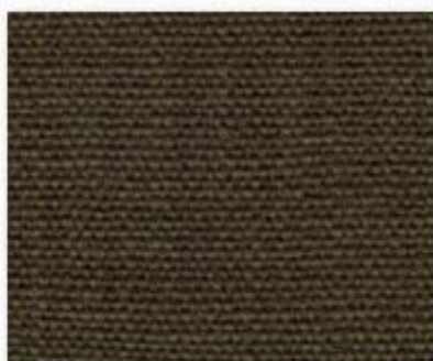
011 vert mousse