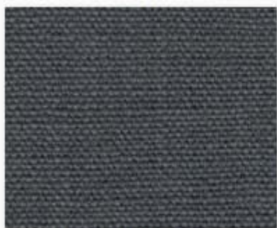
013 bleu de saxe